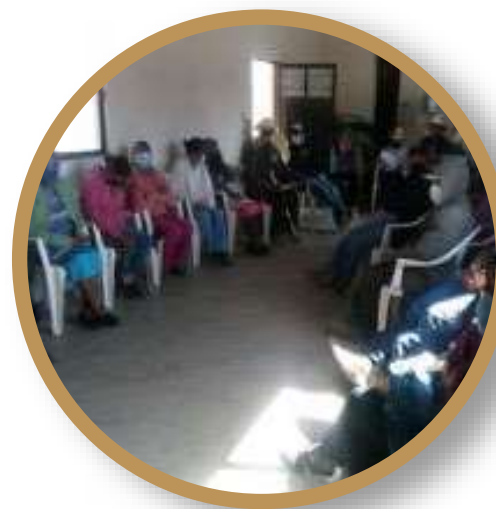
Visitas a núcleos agrarios