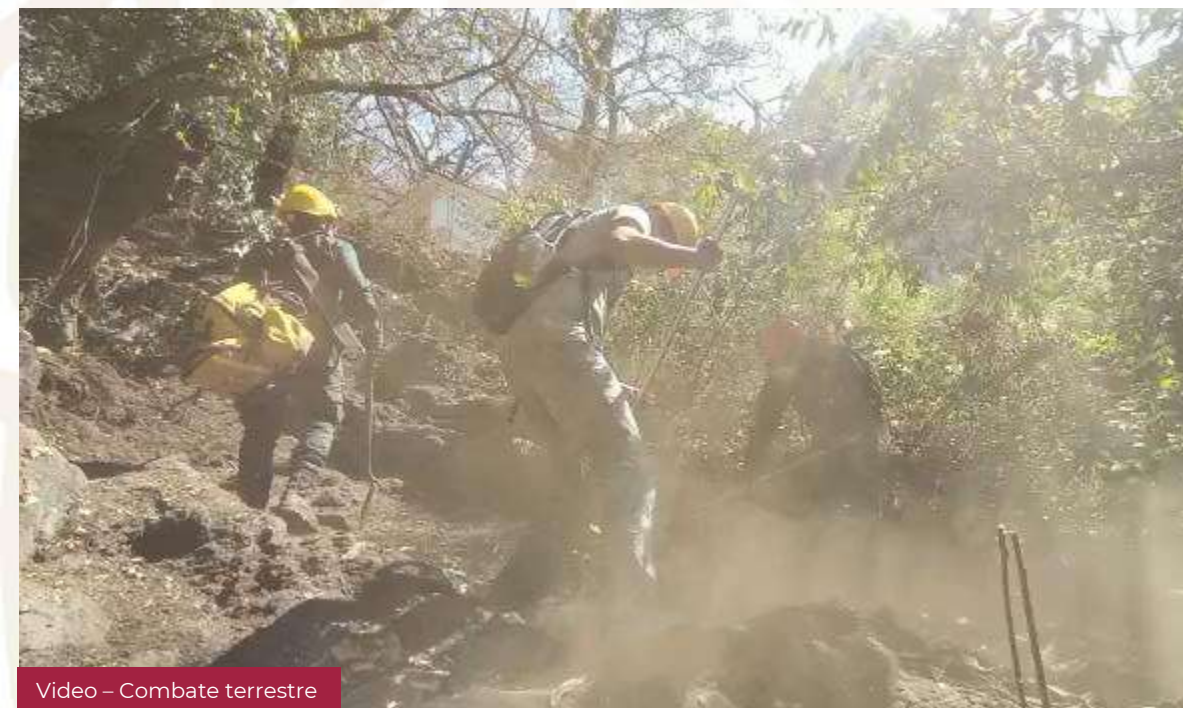
Vídeo – Combate terrestre