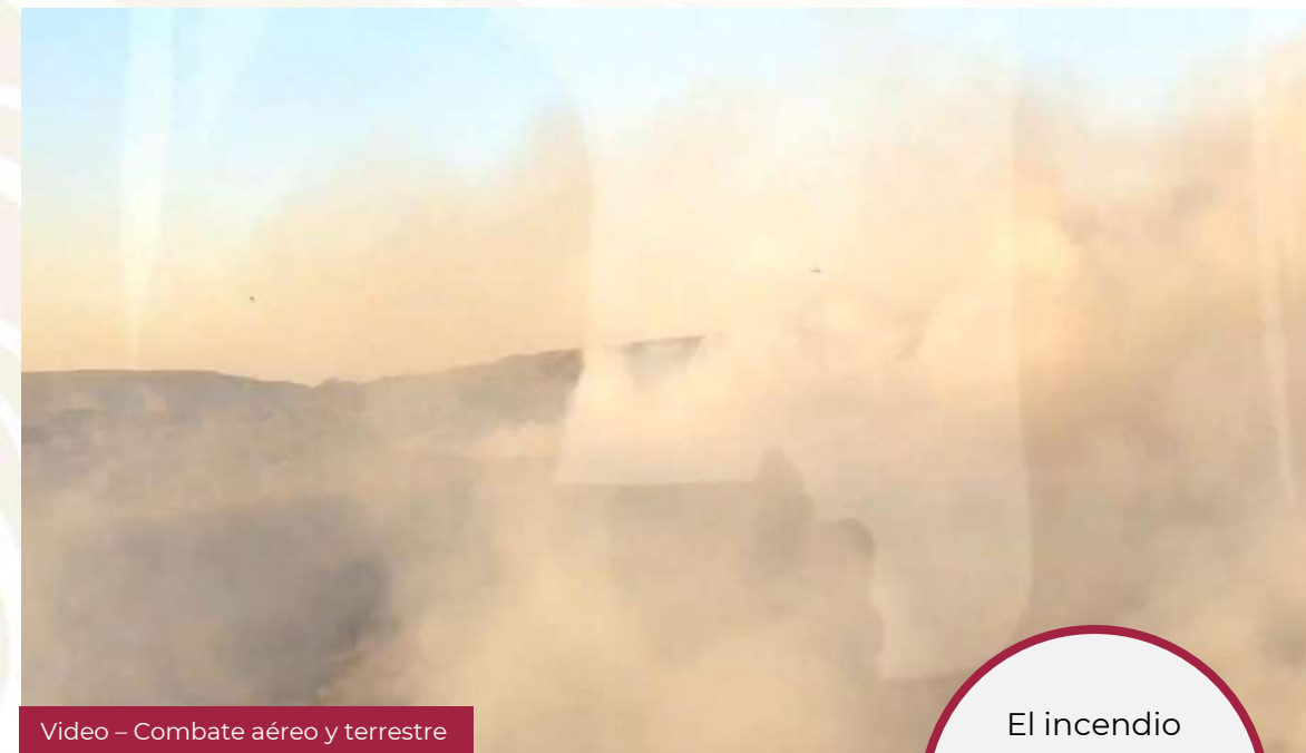
Vídeo - Combate aéreo y terrestre

El incendio no genera peligro para el interfaz urbano - forestal