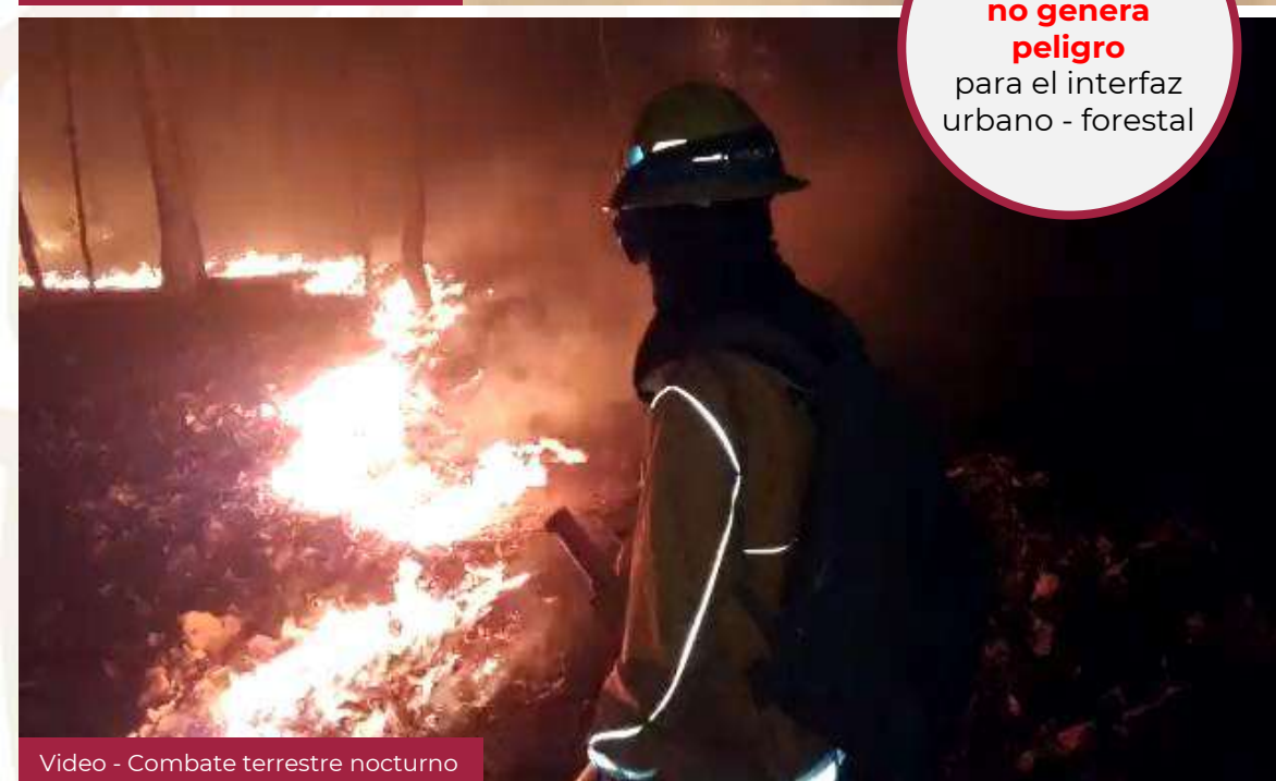
Vídeo - Combate terrestre nocturno

El incendio no genera peligro para el interfaz urbano - forestal