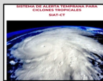
Enlace Manual SIAT-CT SINAPROC