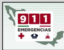
En caso de emergencia marca al 911