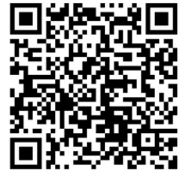
Infografía CENAPRED: "Qué hacer en caso de inundación"