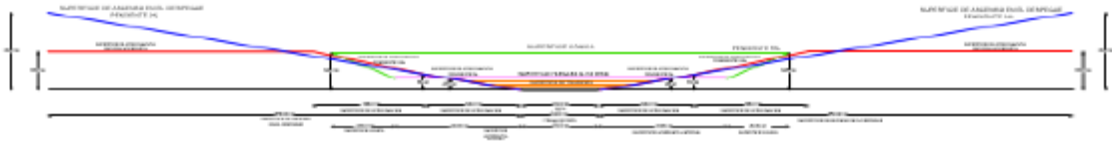
Sección A-A Distancias y Alturas (metros)